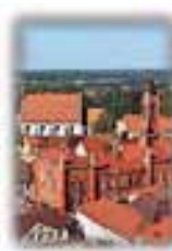
Blick von St. Marien