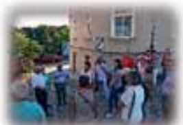
Sachkundige Führung in der Nähe des Saumarktes

Es war ein schöner Tag in Kamenz, es war ein guter Tag für Kamenz!