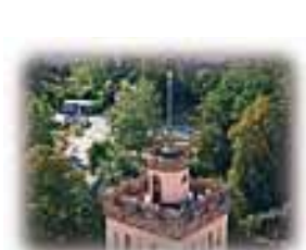
Schöne Aussicht vom Roten Turm

Der Einkaufssonntag mit der 4. Kamenzer Trödelmeile und dem 3. Saumarktfest sowie dem Tag des offenen Denkmals am 9. September zogen wieder tausende Kamenzer und Besucher in die Stadt, vor allem in die Innenstadt. Die Organisatoren und Macher können sich über diese große Publikumsresonanz nur freuen und das Wetter zeigte sich auch von seiner besten Seite.