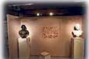
Sonderausstellung zu Lessing und Winkelmann im Malzhaus