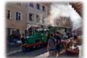
Von einem Ort zum anderen: Der Elsterexpress