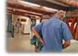
Und sonntags ins Museum