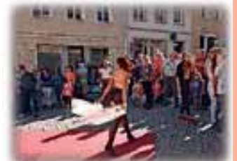
Oh, là, là – Die Vintage-Dessous-Show