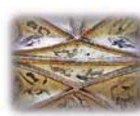
Wandmalereien in des St.-Just-Kirche