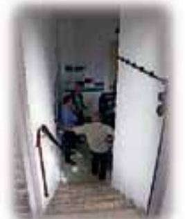
Besuch beim hydraulisch Widder