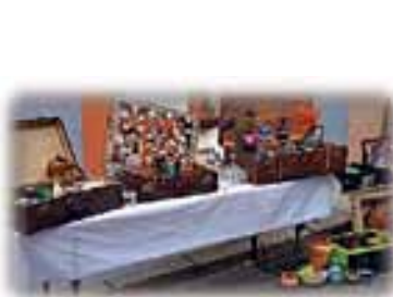
Koffermeile der Stadtwerkstatt