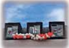
Tanzhaus Kamenz eröffnet