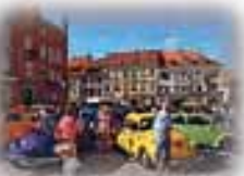
Oldtimer auf dem Markt