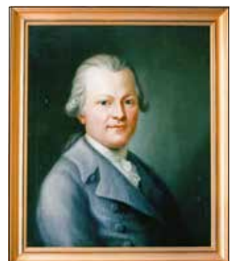
Lessing-Porträt nach Anton Graff

Geplant ist nunmehr, die Kamener Lessing-Tage im Mai und Juni nachzuholen. Auch die Verleihung des Lessing-Preises des Freistaates Sachsen wird 2021 zu einem späteren Zeitpunkt stattfinden. Die Kamener Lessing-Tage stehen 2021 unter dem Motto „Vereinnahmung, Verfolgung, Verführung. Literatur und Kunst im Dritten Reich“. Geplant sind unter dem Motto Vorträge und Lesungen, eine Theateraufführung, zwei Konzerte und die Eröffnung einer Ausstellung zu Lessings Wirkungsgeschichte im Dritten Reich. Das genaue Programm wird bekannt gegeben, sobald die neuen Termine feststehen.