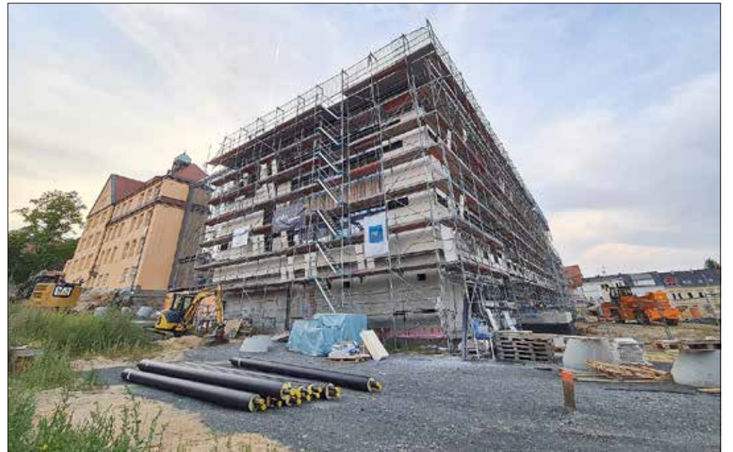
Es geht an der Außenhülle des Erweiterungsneubaus sichtbar voran – Stand 06.09.2021