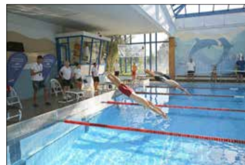
Jetzt zählt jede Sekunde.

Das 12. Sprintmeeting 2023 war nicht ein sportlicher Höhepunkt. Er zeigt auch, nicht nur für den OSSV Kamenz, sondern auch die Bürgerinnen und Bürger der Stadt und aus den umliegenden Gemeinden, wie wichtig die Schwimmhalle für Kamenz und die Region ist und dass auch daher ein Schwimmhallen-Neubau die Zukunft des Vereins und für die sonstigen Nutzern gesichert werden muss.