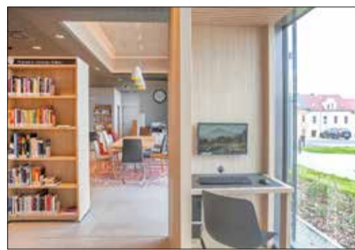
Blick in die Bibliothek: Nicht nur Bücher bestimmen das Medienangebot

Neben 33.000 aktuellen Medien, digitalen Angeboten und Datenbanken sowie Arbeitsplätzen und WLAN punktet die Bibliothek mit fachlicher Kompetenz und alltagstauglichen Öffnungszeiten, die dem Einzelhandel angepasst sind. In den Abendstunden und an den Wochenenden liegt die Verantwortung für die moderne Einrichtung in den Händen der Nutzer. Die so genannte OpenLibrary, die seit Juni 2023 in Betrieb ist, stellt ein Novum in der Region dar. Der eigenständige Zutritt erfreut sich eines großen Zuspruchs. Berechtigt sind Personen ab 16 Jahre mit gültiger Bibliothekskarte. Wer den Service in Anspruch nehmen möchte, erhält an der Service-Theke eine Einweisung und wird freigeschaltet. In den ersten drei Monaten wurden über 400 Nutzer registriert.