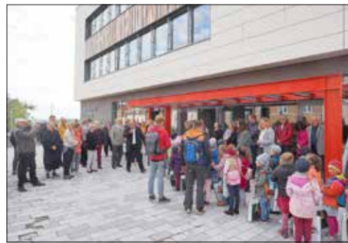
Vor einem Jahr am 30. September 2022: Großer Bahnhof vor den neuen Räumlichkeiten der Stadtbibliothek „G. E. Lessing“

Zwölf Monate nach Eröffnung des Erweiterungsbaus an der Oststraße hat die Kamener Stadtbibliothek ihren Praxis-Test bestanden. Im städtischen „Wohnzimmer“ finden Menschen zwanglos zueinander, arbeiten Schüler allein oder gemeinsam, wird in aktuellen Magazinen geblättert, amüsieren sich Groß und Klein im Gaming-Schneckenhaus oder im Probierstübchen mit den Mini-Robotern. Musikliebhaber geben spontane Klavierkonzerte. Jugendliche chillen auf den Sitzpolstern. Hier wird gelernt, gelesen und gelacht – und an den Selbstbedienungsautomaten stapelweise verbucht. Täglich werden durchschnittlich zwischen 600 und 900 Exemplare ausgeliehen.