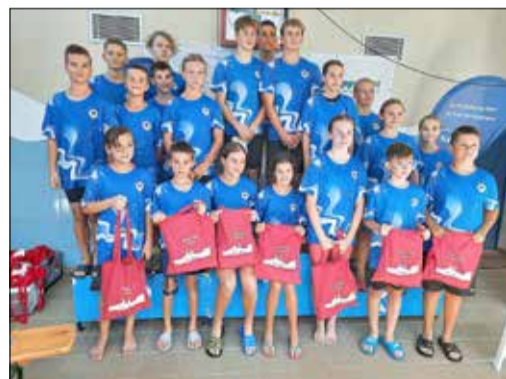
Die Kolíner Mannschaft mit den Gastgeschenken beim Foto-Shooting.

Mit zehn teilnehmenden Vereinen, davon neun aus Sachsen, und insgesamt 158 Starterinnen und Startern war eine Rekordbeteiligung für das Sprintmeeting erreicht, welche an absolute Belastungsgrenze der Kamenzer Schwimmhalle ging.