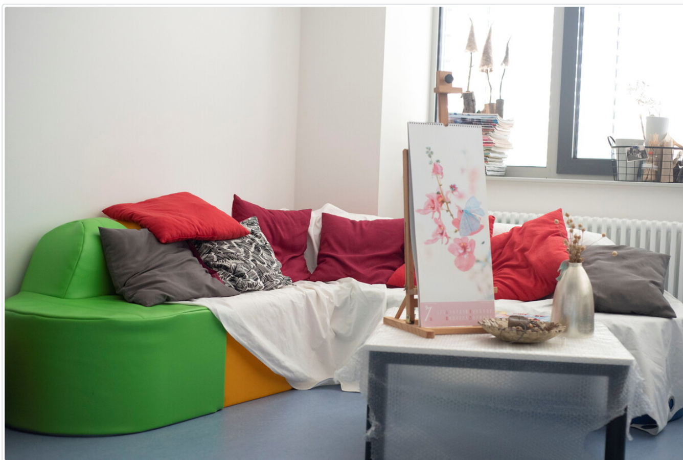
Chill-Ecke im Schulhaus.