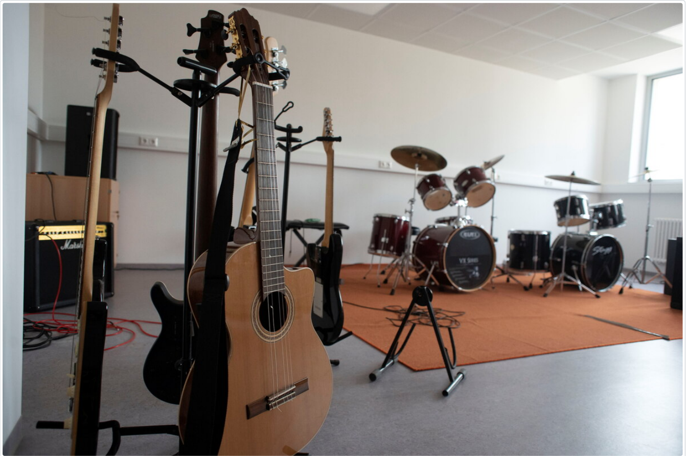
Auch ein Musik-Kabinett wurde geschaffen.