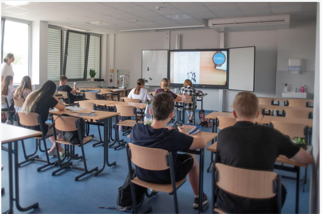
In großen Klassenzimmern wird künftig unter modernsten Voraussetzungen gelernt.