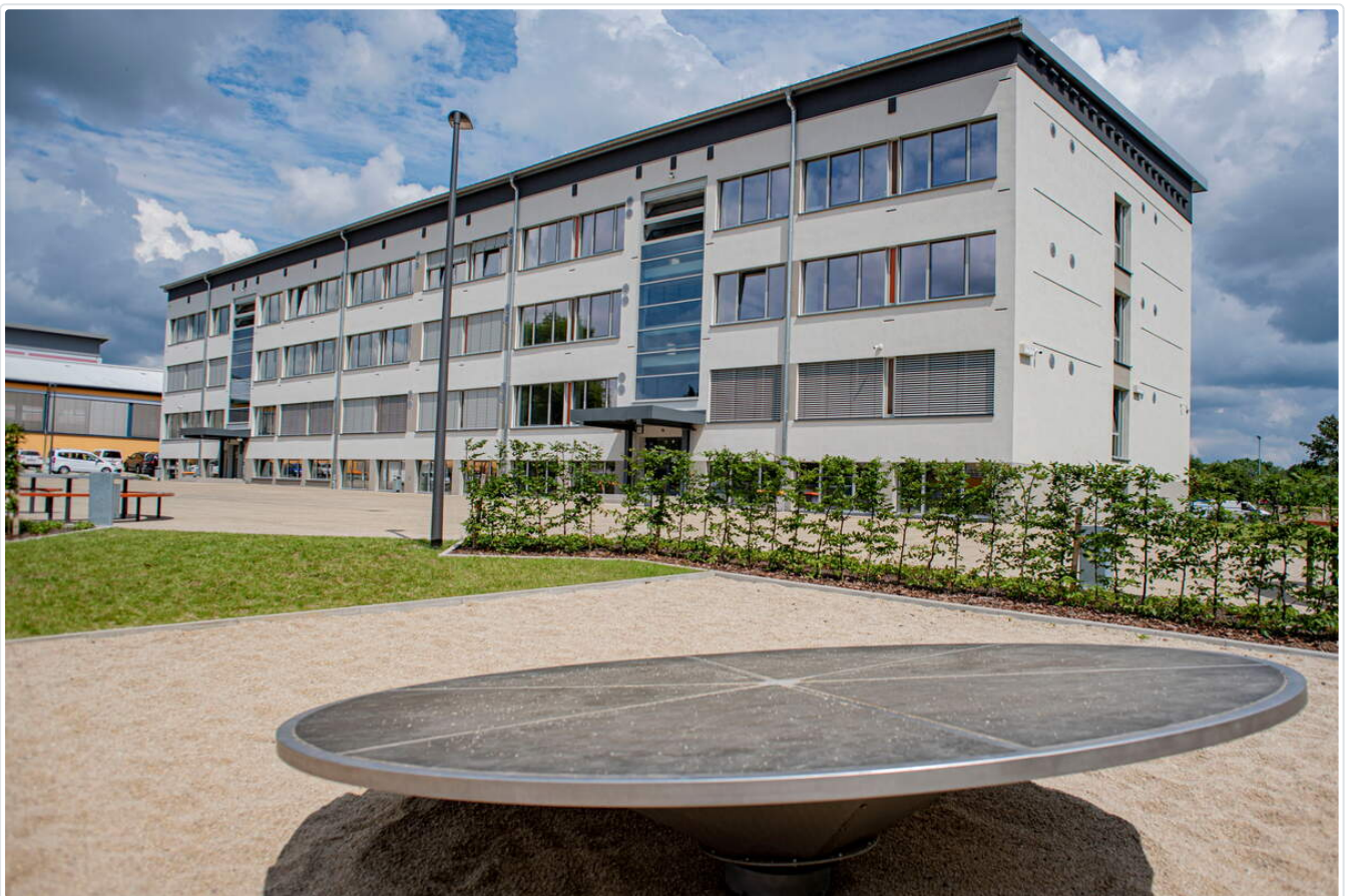
In den Pausen kann es jetzt draußen im Hof auch auf eine Drehscheibe gehen.