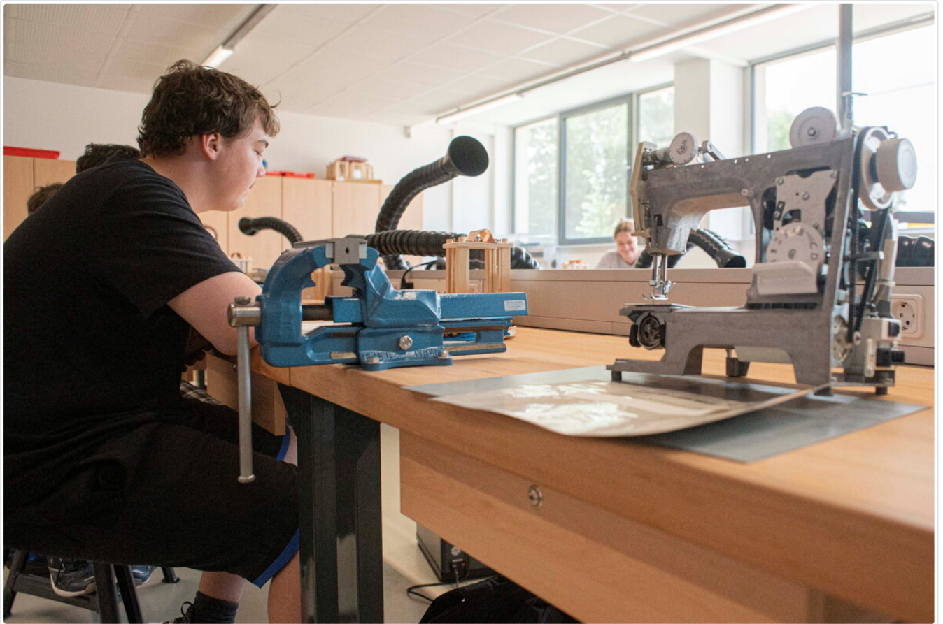
Eines der WTH-Kabinette.