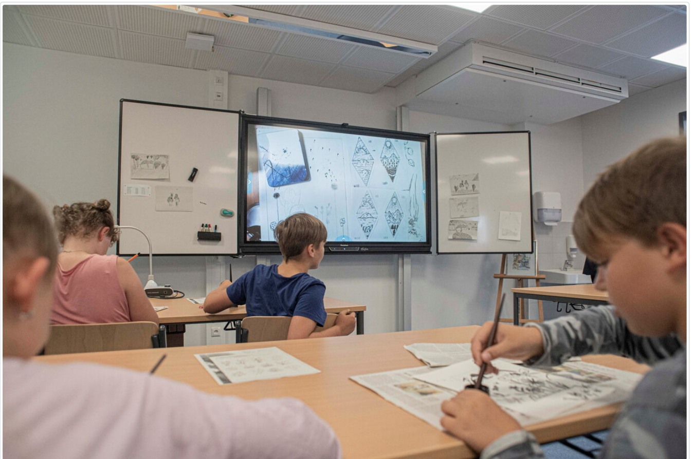
28 digitale Tafeln besitzt die Oberschule an der Elsteraue.