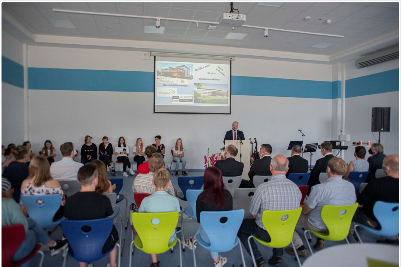
Zur Eröffnung am 15. Juli waren viele Gäste in die Aula der Schule gekommen und hörten