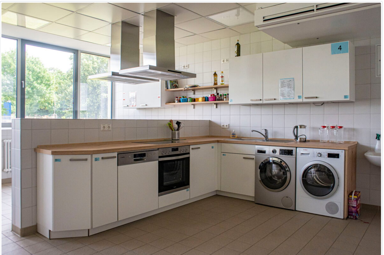
Die neue Lehrküche.