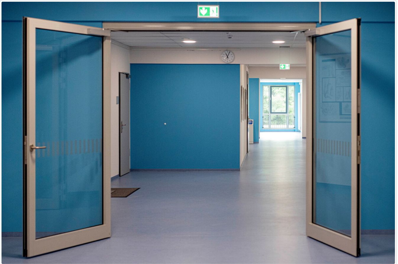
Großzügige und behindertengerechte Gänge sorgen für Barrierefreiheit.