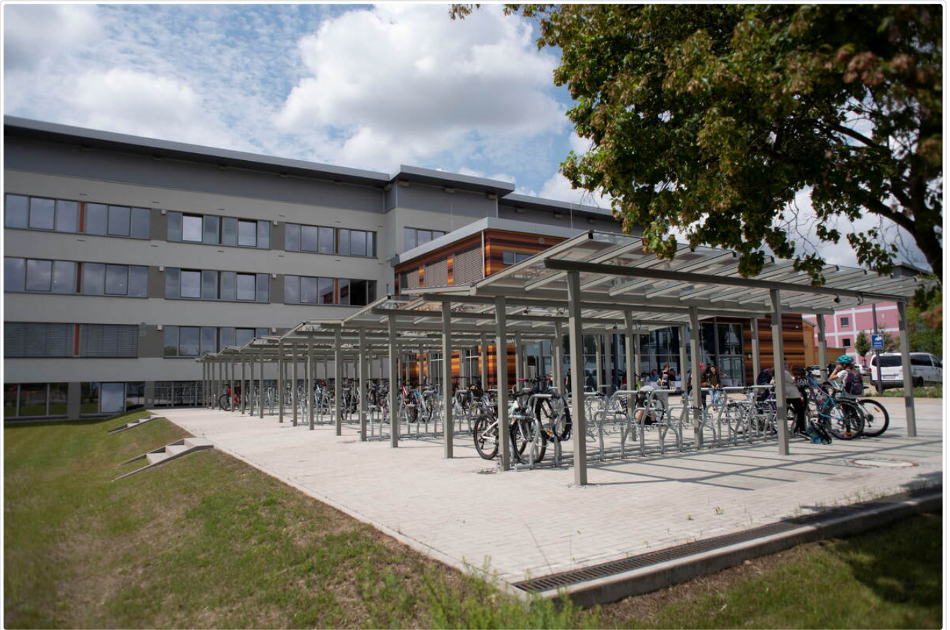
Der Haupteingang befindet sich jetzt an der Saarstraße. Auch genügend Stellplätze für Räder gibt es.