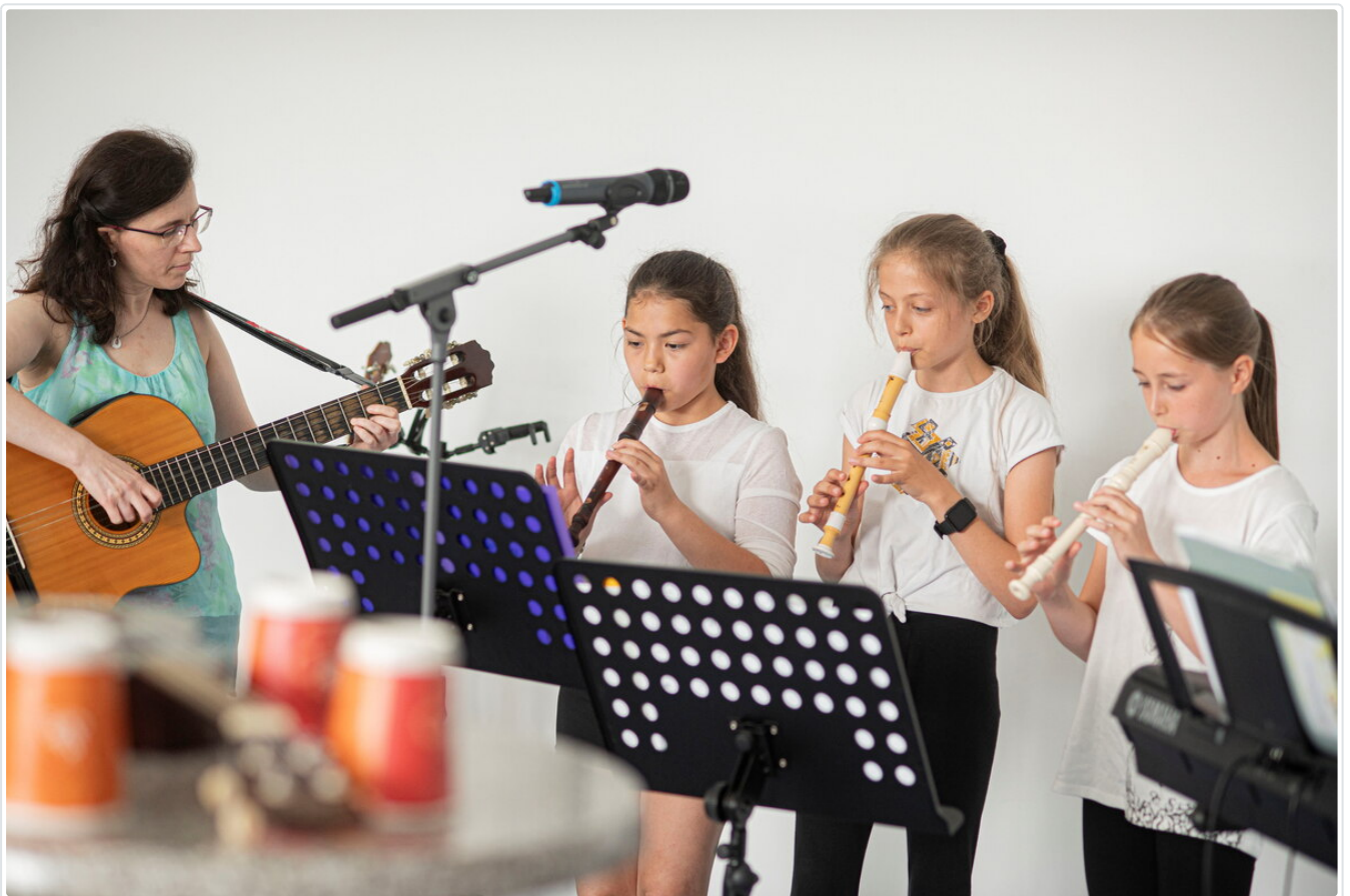
Musik zum Eröffnungsprogramm.