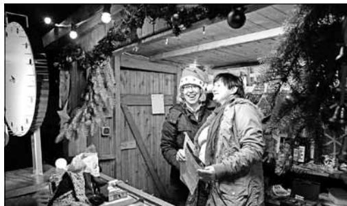
Tombola mit Glücksrad auf dem Wieser Weihnachtstreffen