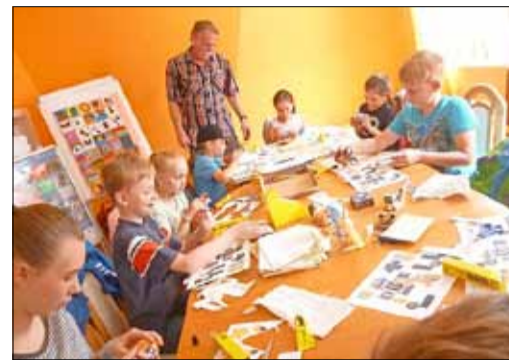
Beim 3-D-Basteln war Geduld und Fingerfertigkeit gefragt

Wie gesagt, wir hätten noch viel mehr Beispiele bringen können, um zu zeigen, wie in diesem Jahr der „Ferienspaß“ war. Natürlich gehen wir jetzt daran – und das ist ein Versprechen – den SOMMERFERIEN(S)PASS 2018 vorzubereiten. Wir hoffen dann sehr, dass wir im nächsten Jahr vertraute Gesichter wiedersehen, freuen uns aber auch, wenn noch mehr Kinder die Möglichkeiten dieses gemeinschaftlichen Ferienangebotes nutzen.