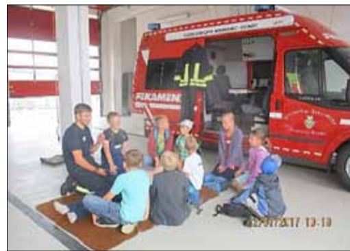
Die Feuerwehr Kamenz war auch in diesem Jahr ein Anziehungspunkt