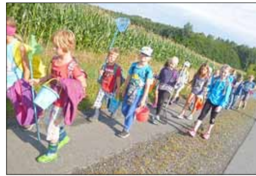
Naturfreunde auf dem Weg zum Tümpeln