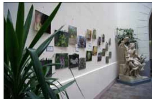
Foto-Projekt des DRK-Horts „Regenbogen“

Seit Dienstag, dem 8. August 2017, kann im Lichthof des Rathauses eine kleine Foto-Ausstellung besucht werden. Im Rahmen des Foto-Projekts „Wer hat Lust auf Fotografie?“, durchgeführt vom