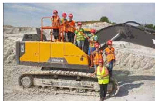
Spannendes erfahren die Kinder über Kaolin – ein Schatz der Natur