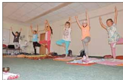
Joga – ganz schön anstrengend beim Joga das Gleichgewicht zu halten