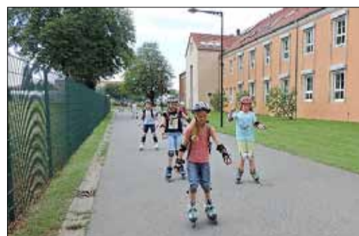
Beim Inlineskaten lernten die Kinder sichere Schritte, Bremsen und gekonntes Fallen