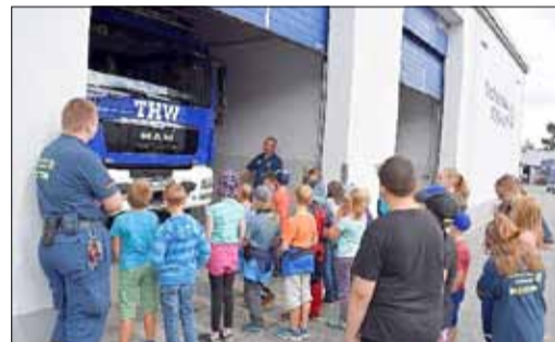
Beim Technischen Hilfswerk Kamenz gab es viel Interessantes zu sehen

Abschließend ein kleiner Rückblick mit Impressionen zu den vielen und tollen Sommerangeboten. Natürlich können an dieser Stelle nicht alle Aktivitäten aufgezählt werden. Dazu reicht leider der Platz nicht aus. Es ist nur ein Ausschnitt von dem, was in den Ferien angeboten wurde.