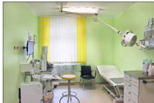
Allgemeinchirurgischer Untersuchungsraum im MVZ