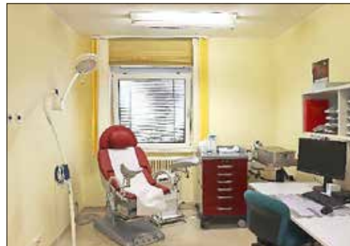
Proktologischer Untersuchungsraum im MVZ