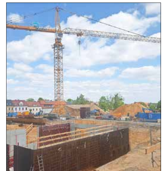
Stand der Bauarbeiten am Erweiterungsneubau an der Lessingschule am 17. Mai 2020