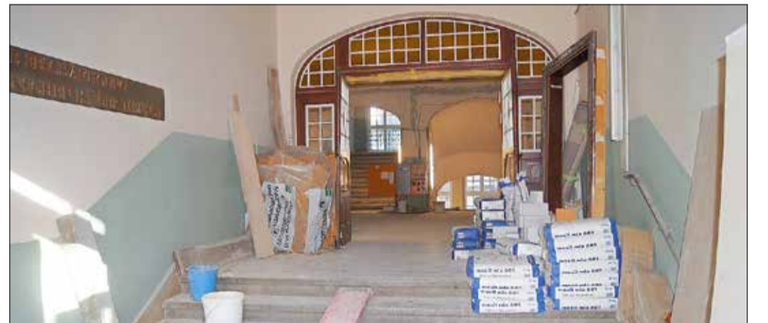
Haupteingang des historischen Gebäudes der Lessingschule am 09.11.2021 - Man sieht, hier wird fleißig gearbeitet.