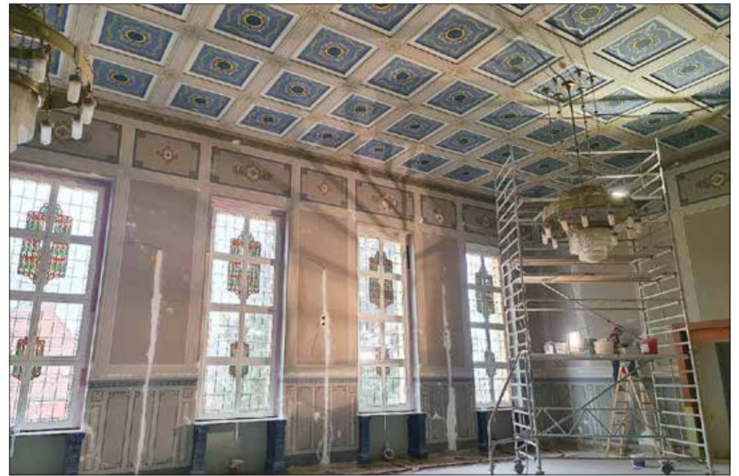
Wie überall im Neu- und im Altbau des innerstädtischen Gymnasiums wird auch in der Aula fleißig gewerkelt – 29.03.2022