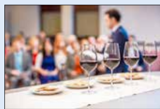
Gottesdienst am wichtigsten Feiertag von Jehovas Zeugen

Jedes Jahr gedenken Jehovas Zeugen auf der ganzen Welt des Todes Jesu. Das tun sie gemäß dem Vorbild der ersten Christen genau an dem Abend, an dem Jesus mit seinen Aposteln das Passah feierte. Es ging in die Geschichte als „das letzte Abendmahl“ ein. Im Mittelpunkt dieses besonderen Gedenkgottesdienstes am Freitag, den 15. April 2022 um 20:00 steht die Dankbarkeit für das Leben und Sterben Jesu und was das für jeden einzelnen Menschen bedeutet. Im vergangenen Jahr nahmen weltweit über 21,3 Millionen Besucher an dieser denkwürdigen Feier digital teil.