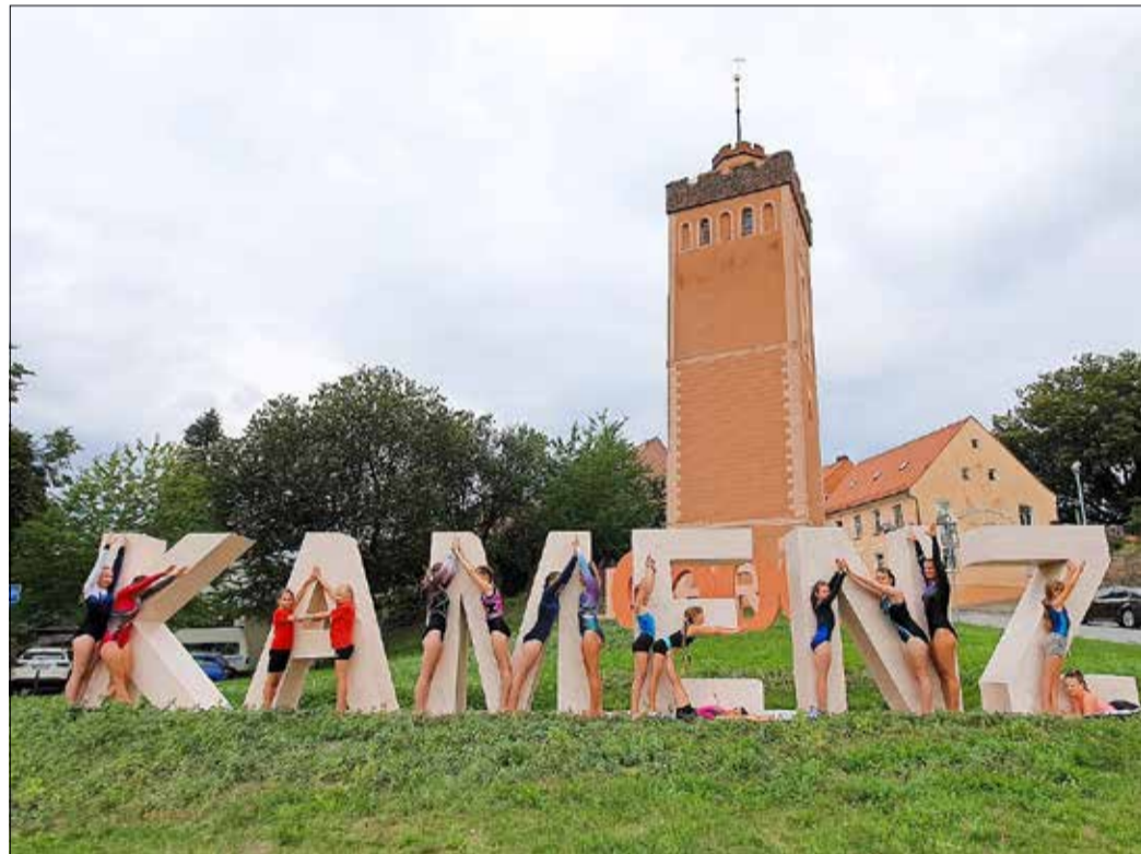
Solche Fotos sind möglich. Aber bitte nicht auf die Buchstaben klettern – Gefahr für Gesundheit und Skulptur!