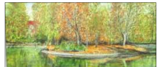
Zeichnung: Wolfgang Letsch