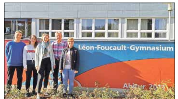
Das Team der Schüler-GmbH „Help4U“, Léon-Foucault-Gymnasium Hoyerswerda

Auch im Schuljahr 2018/2019 werden wieder die besten Schülerbusinesspläne der Lausitz ausgezeichnet. Für den mit 2.500 Euro dotierten Preis können sich Schüler der Lausitz der Sekundarstufen I & II ab der achten Klasse bewerben und ihr Schülerfirmenkonzept bis zum 31. Mai 2019 bei der Wirtschaftsinitiative Lausitz einreichen. PI