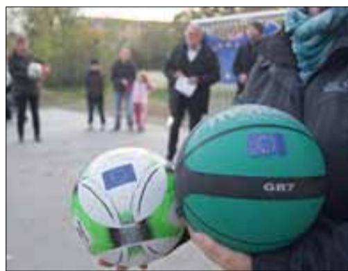
Ohne Ball kein Bolzen – zur Einweihung durften die Gäste die neue Anlage gleich ausprobieren.

Am letzten Oktoberdienstag konnte der neu gestaltete Bolz- und Basketballplatz in der Christian-Weißmantel-Straße mit Multifunktionssportgerät und Verweilmöglichkeiten, wie neuen Bänken und einer Hütte, feierlich an diejenigen übergeben werden, für die er gebaut wurde – die Jugendlichen des Kamenzer Neubaugebiets. Etwa 130.000 Euro kostete das Projekt insgesamt, das innerhalb von drei Monaten Bauzeit von den Planern Dr. Braun & Barth, Freie Architekten Dresden und der DIW Bau GmbH realisiert wurde. Dank des Europäischen Fonds für regionale Entwicklung können 80 % der Baukosten aus Fördermitteln gedeckt werden. Die Herstellung dieser Grün- und Freizeitfläche ist eine stadtentwicklungsrelevante Verbesserung der Freizeitbedingungen im Neubaugebiet.