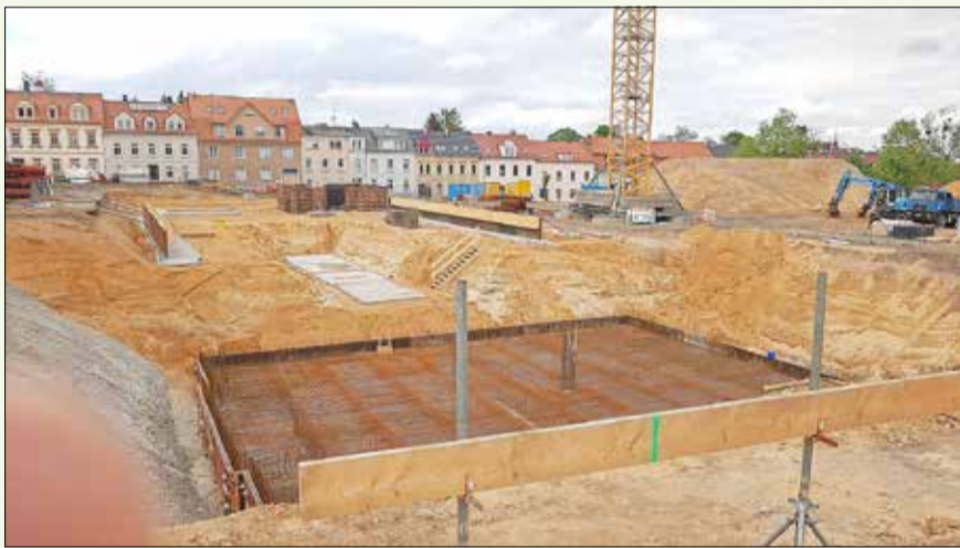
Stand der Bauarbeiten hinter der Lessingschule und der Pflasterarbeiten vor der Lessingschule am 3. Mai 2020