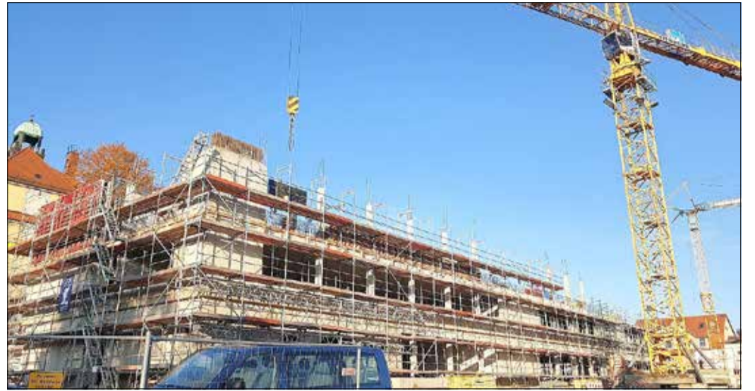
Während auf der einen Baustelle die Arbeiten im vollen Gange sind, nähern sie sich auf der anderen langsam, aber sicher ihrem Ende.