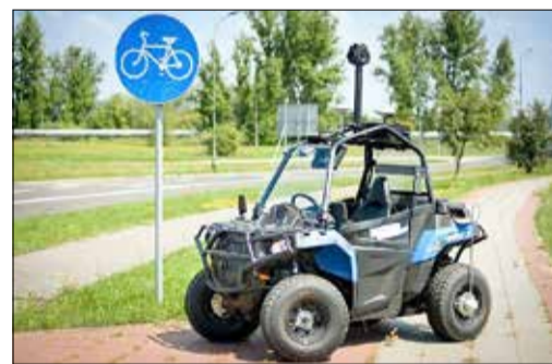
Messfahrzeuge zur Erfassung von Ebenheit und Substanzmerkmalen