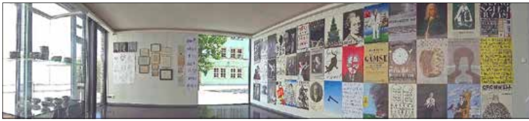
Blick in den Ausstellungsraum