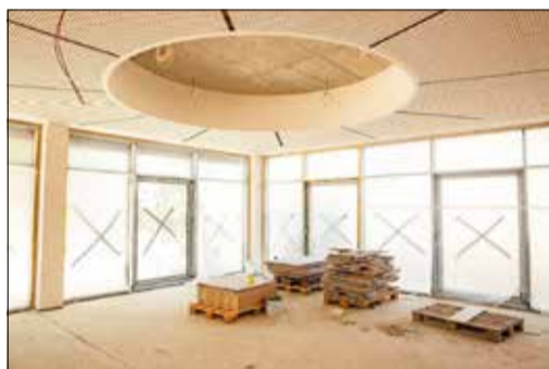
Bald wird im Kinderbereich der neuen Bibliothek immer die Sonne auf die jüngsten Bibliotheksnutzer scheinen.

Besichtigung der neuen Räumlichkeiten trotzdem am 21. August 2022 ab 14 Uhr möglich