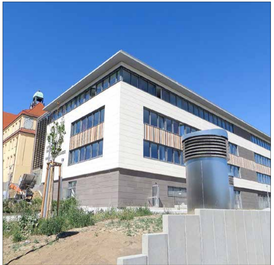
Blick auf den innerstädtischen Gymnasialstandort von der Haberkornstraße aus (Stand: 08.08.2022)