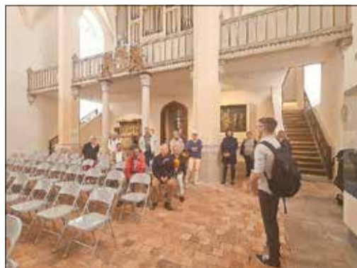
Führung in der Klosterkirche (Sakralmuseum)

Gleiches trifft auch auf den Tag des offenen Denkmals zu, bei dem die Kamener Museen und Sammlungen, die ev.-luth. Kirchengemeinde sowie der Kamener Geschichtsverein gemeinsam mit der ewag kamenz unter dem fast kriminalistische anmutenden Motto „KulturSpur. Ein Fall für den Denkmalschutz“ inhaltlich attraktive Angebote zu unterbreiten wussten – bis hin zu Besichtigungen eines restaurierten Gartenpavillon des ehemaligen Schlosses Biehla oder des Hydraulischen Widders bei Lückersdorf.