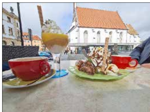
Schlemmen und Genießen

In diesem Sinne sei den Genannten, aber auch allen anderen Mitwirkenden, die nicht genannt wurden, ganz herzlich gedankt, dass sie Zeit und Kraft für einen schönen Tag in Kamenz aufgebracht haben: Vielen Dank!