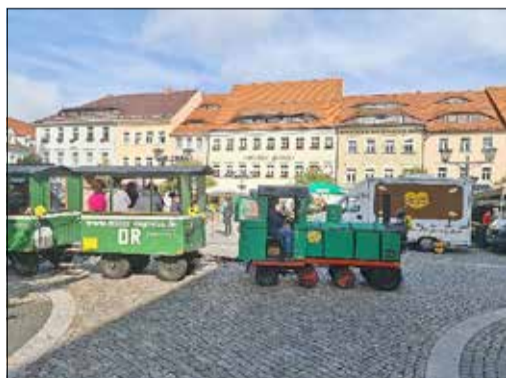
Elsterexpress von der Innenstadt nach Kamenz Nord

Gleiches trifft auch auf den Tag des offenen Denkmals zu, bei dem die Kamener Museen und Sammlungen, die ev.-luth. Kirchengemeinde sowie der Kamener Geschichtsverein gemeinsam mit der ewag kamenz unter dem fast kriminalistische anmutenden Motto „KulturSpur. Ein Fall für den Denkmalschutz“ inhaltlich attraktive Angebote zu unterbreiten wussten – bis hin zu Besichtigungen eines restaurierten Gartenpavillon des ehemaligen Schlosses Biehla oder des Hydraulischen Widders bei Lückersdorf.