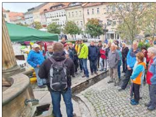
Wanderweg „Wasser“

An diesem Tag war fast für jeden etwas im Angebot. Die einen konnten in Ruhe shoppen oder trödeln (auch im Sinne von sich Zeit lassen) sowie die Kamener Gastronomie genießen, die anderen suchten historische „Gemäuer“ auf, um wieder viel Wissenswertes und Interessantes aus der Geschichte der Stadt Kamenz zu erfahren oder machten sich auf, um den vierstündigen Wanderweg „Wasser“ zu absolvieren (Respekt!). Dieser Tag, organisiert vom städtischen City-Management und der City-Initiative, hier besonders der Einkaufssonntag und die Trödelmeile, hatte viele Mitstreiter und Mitstreiterinnen in der Vorbereitung und Durchführung. Aber nur so konnte er auch so anziehend werden und tausende Kamenerinnen und Kamener sowie auswärtige Gäste in seinen Bann ziehen.