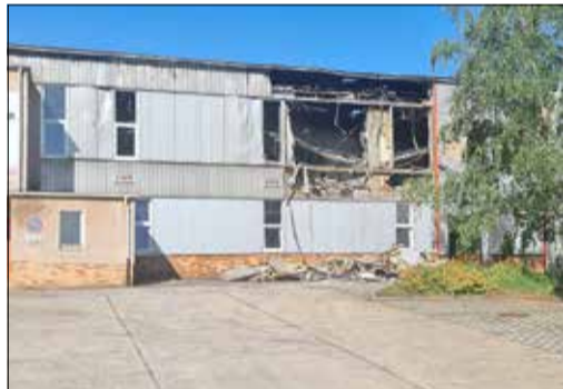
Der Schaden auf dem Werksgelände an der Nordstraße ist groß.