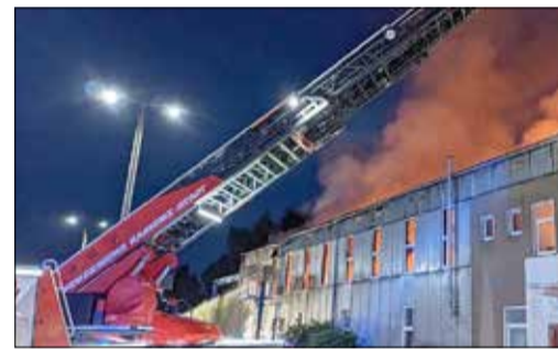
Kamener Feuerwehren und andere bekämpfen den Brand und verhindern auch ein Übergreifen auf Nachbargrundstücke.

teil. Ebenso kamen spezielle Messgeräte der Betriebsfeuerwehr der Accumotive GmbH & Co. KG zum Einsatz. Auch die Weinhold Feuerwehrbedarf GmbH Kamenz war mit der Bereitstellung zusätzlicher Schaummittel beteiligt.