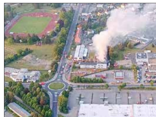
Luftbild des Brandortes

Innerhalb der Brandbekämpfung wurden Kräfte der Polizei, der ewag kamenz und SachsenEnergie AG, des Rettungsdienstes (Falck) und des THW sowie auch der Oberbürgermeister einbezogen. Ebenfalls am Einsatz beteiligt war der Kreisbrandmeister Puls. Der Einsatz konnte erst in den frühen Nachmittagsstunden am Pfingstsonntagabend beendet werden.