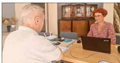
Der erste Besucher am Donnerstag, dem 13. Juli in Kamenz und er war froh, dass er zu der Beratung nicht nach Hoyerswerda oder Bautzen musste.