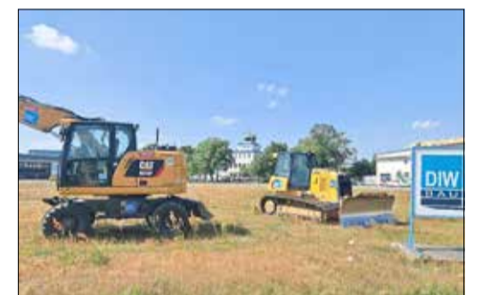
Blick vom zukünftigen Baugelände auf den Flugplatz-tower

Am Montag, dem 17. Juli 2023 fand auf dem Gebiet des Verkehrslandeplatzes Kamenz der 1. Spatenstich für ein 2,5 ha großes Gelände statt. Der Verkehrslandeplatz befindet sich in der öffentlichen Hand (Flugplatz Kamenz GmbH; Zuschuss der Gesellschafter insgesamt 106.000 EUR pro Jahr 60% Stadt Kamenz/40% Landkreis Bautzen). Betrieben wird er seit 2024 durch den Fliegerclub Kamenz e.V. und verzeichnet pro Jahr 18.000 Flugbewegungen, was für einen Verkehrslandeplatz dieser Größenordnung ein sehr ordentliches Ergebnis ist. Gegenwärtig sind zehn Unternehmen angesiedelt.