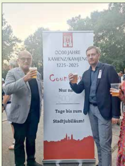
Sie – der OB und der MP – lassen sich ein Bier schmecken: Am Sonnabend waren es genau noch 500 Tage bis zum Jubiläumsjahr 2025 der Stadt Kamenz.