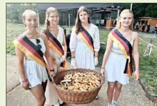
Diesen jungen Damen kann man sicherlich die Countdown-Brötchensemmeln nicht abschlagen.