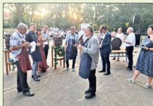
Also denn: Mit „Jägermeister“ Prost auf Kamenz.