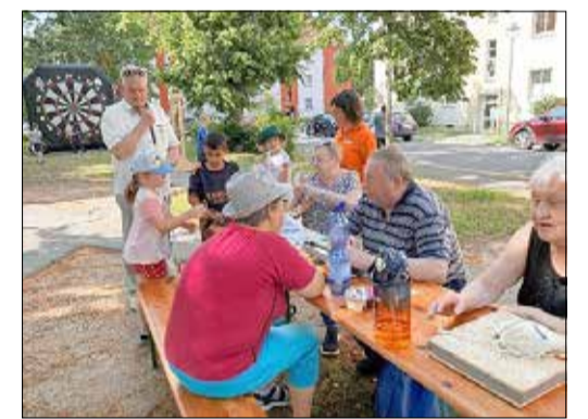
Familienfest auf dem August-Bebel Platz