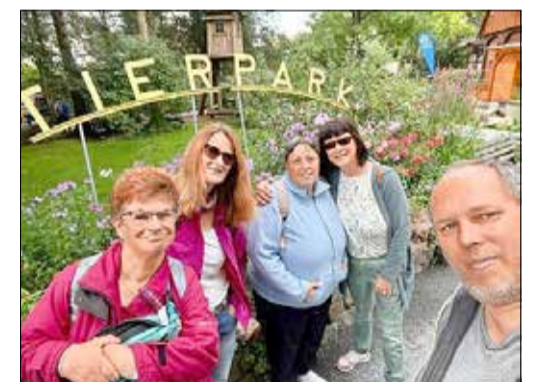
Ausflug zum Bischofswerdaer Zoo