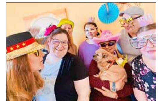
Faschingsfeier im Bürgerladen