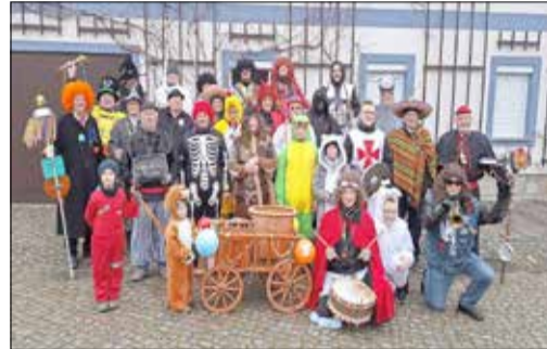
Jesau Helau ... Ihr Männergesangsverein

Liebe Jesauer, wir kommen am Samstag, dem 14.02.2026 mit Musik und tollen Kostümen zampern. Wir freuen uns auf Ihre „Zampergaben“ und danken mit einem Lied und einem Schnäpsschen.