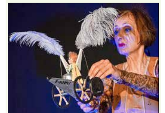
Der kleine Prinz

Die Ausstellung gibt einen Einblick in die Vielfalt der Sammelobjekte des Lessing-Museums und die Kontexte, in denen sie entstanden sind. Zaubenhaftes Figurentheater für die ganze Familie (Kinder ab 10 Jahren) können Sie am Sonntag, dem 14. Februar, 17.00 Uhr, im Stadttheater Kamenz erleben. Dann heißt es, „Der Kleine Prinz unterwegs zu den Sternen“ . Es gastiert das Figurentheater Weidinger aus Erfurt.