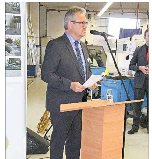
In seiner Dankesrede bedankte sich der Geschäftsführer besonders bei den Mitarbeitern des Unternehmens

Auch diese Traditionen und Wurzeln sind Ausgangspunkt für das mit Erfolg geführte Unternehmen seitens des Geschäftsführers und des Gesellschafters bzw. der Gesellschafterin. Hinzu kommen die Tatkraft und die Leistungsbereitschaft der Belegschaft, die auch half, schwere Zeiten zu überstehen. Heute sind sie Garanten für ein prosperierendes Unternehmen, dessen Leitspruch „Präzision aus Meisterhand“ lautet. Der Einsatz hochmoderner CNC-Werkzeugmaschinen, aber auch solider und hochwertiger konventioneller Technikausstattung haben viel Auftraggeber aus dem Maschinen-, Anlagen- und Fahrzeugbau sowie der Antriebs-, Medizin- und Messtechnik.