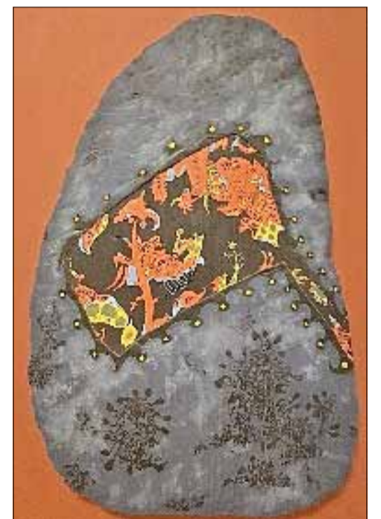
„Triumph“ von 1998 (Acrylmalerei auf historischem Holz)