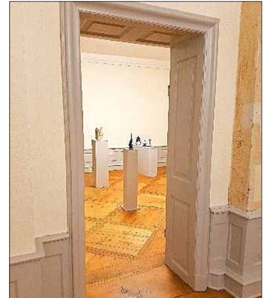
Blick in den Raum mit Holz-, Bronze- und Sandsteinarbeiten

mit künstlerischer Akribie neue ästhetische Gestaltqualitäten heraus.