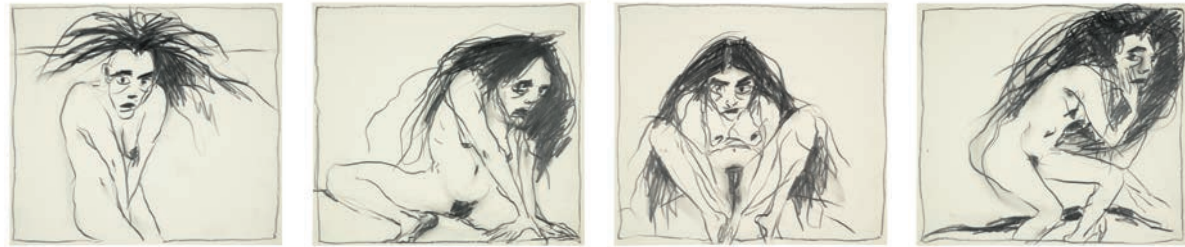
6 / 4 Blätter aus der Serie: Wende / 1989 Bleistift auf Papier je 24,7 × 27,6 cm

— Life and death, animal and human, the relationship between man and woman. These are the existential themes at the heart of Angela Hampel's work. They are often expressed through mythological archetypes.