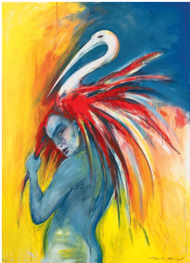
1 / Phönix / 2008 / Mischtechnik auf Leinwand / 160 x 120 cm Sächsische Landesärztekammer, Dresden