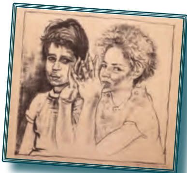
Lea Grundig: »Oberschülerinnen« ▲