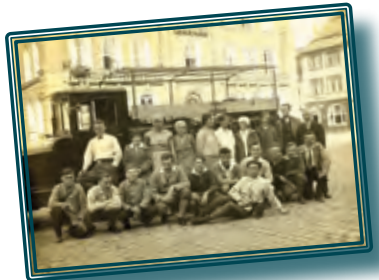
Vor fast 100 Jahren: Mitglieder der Adventgemeinde vor dem Kamener Rathaus

Mit einem Wissensquiz, einem kostenlosen Buchangebot sowie einer Einladung zum Gedankenaustausch sind wir an gewohnter Stätte präsent.