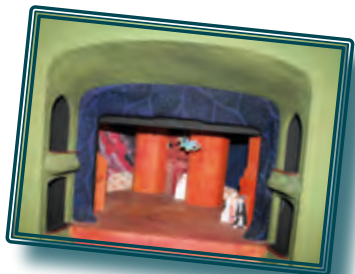
Bühnenbildmodell zu »Nathan der Weise«, 1994 in München ▶

Ein Bühnenbildmodell für eine Theaterinszenierung ist eine detaillierte, maßstabsgetreue, dreidimensionale Miniaturdarstellung des geplanten Bühnenbildes mit Kulissen. Für Regisseure, Bühnenbildner und Werkstätten stellt es ein zentrales Arbeitsinstrument dar. Gezeigt werden zwei Modelle zu »Nathan der Weise« (1979, 1994) und je ein Modell zu »Minna von Barnhelm« (1995) und »Emilia Galotti« (2001).