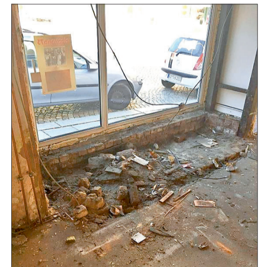
Das sieht nach einem Berg von Arbeit aus ...

vor rund drei Wochen war Baubeginn in der Kurzen Straße 2 in den ehemaligen Räumlichkeiten von EP-Böttcher. Dieses in Kamenz sehr bekannte Geschäft hat sich räumlich verkleinert, aber den Geschäftsbetrieb bereits wieder aufgenommen.