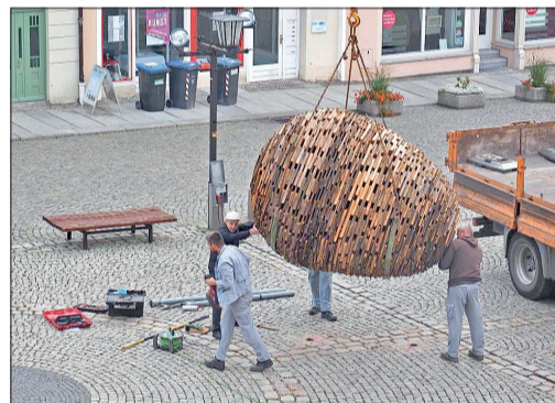
„Es“ schwebt ein ...

Aber es ist schon interessant zu sehen wie neugierig, aber auch mit einer gehörigen Skepsis die Besucher des Kamener Marktes auf das großdimensionierte, eiförmige Kunstobjekt reagieren. Oder wie Eltern ihren Kindern Rede und Antwort stehen müssen, was das denn sei. „Wo kommt das her?“, „Was soll das überhaupt?“ oder „Sieht doch eigentlich ganz interessant aus, oder?“, so oder ähnlich lauten vielleicht die Fragen, die man sich stellt. Und mit Fragen beginnt bekanntlich auch die Suche nach Antworten. Erfolgt dies durch ein attraktives, sinnlich wahrnehmbares Objekt - umso besser. Kunst, die diese Bezeichnung verdient, sollte Fragen stellen oder in Frage stellen.