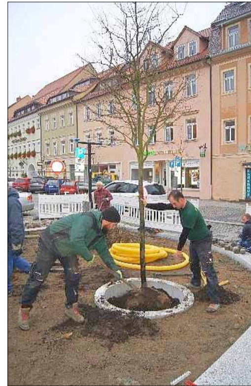
Einpflanzung der Kupfer-Felsenbirne am Andreasbrunnen

Am Wurzelballen des Baumes wird durch eine Eisenspitze (Fäustel) zum einen erreicht, dass der Baum von Anfang an eine höhere Standfestigkeit hat, zum anderen – und das ist vielleicht noch wichtiger – bringt es die Konstruktion der Eisenspitze mit sich, dass der Baum samt Wurzel – natürlich nicht sichtbar – „vibriert“, sich also bewegt. Der Zweck ist ein ganz einfacher: Durch die erzeugte Bewegung des Baumes wird das Wurzelwachsen in einem viel größeren Maße angeregt als es normal möglich wäre und damit erreicht, dass auch dadurch der Baum schneller an Festigkeit gewinnt.