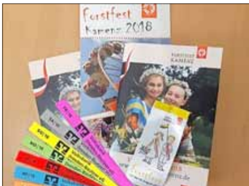
Eintrittspreise, Abzeichen und Hefte

Wie in den letzten Jahren werden auch zum diesjährigen Forstfest die bewährten Einlassbänder zum Einsatz kommen, die zum Eintritt auf dem Festgelände im Forst berechnen. Es können sowohl Wochenpakete für die gesamte Festwoche (Kamenz-Information, Bürgerservice, Forst) als auch Tagesbänder (nur Forst) für einzelne Festtage zum Voll- und ermäßigten* Preis erworben werden. Das beliebte Festabzeichen kann wieder mit neuer Gestaltung als Sammlerstück in der Kamenz-Information und an den Kassen im Kamenz Forst für 1,00 EUR erworben werden. Es hat jedoch keine Gültigkeit für den Eintritt. Käufer des Wo-