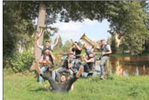
Die Kremsermugge erfreut die Besucher mit Blasmusik

Für die Freunde der Kultur wird es ein Platzkonzert der Kremsermugge - Blasmusik aus dem Pulsniztal geben!