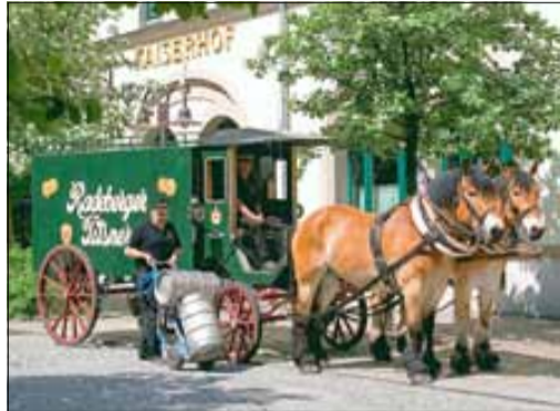
Der Fuhrbetrieb Trepte ist mit seinem Radeberger Brauereigespann dabei und verteilt fleißig Freibier. Für Kinder gibt es auch ein Freigetränk.

Um das für unsere Gäste so interessant wie möglich zu gestalten, haben wir uns ein umfangreiches Programm überlegt: Pferde-Physiotherapeuten und -Osteopathen stellen ihre Arbeit vor, es wird eine Ausstellung mit Fotografien geben, Info-Stände und -Tafeln und Einblicke in viele Bereiche rund um das Thema Pferd. Aber das wichtigste ist natürlich der große kostenfreie Bereich extra für Kinder! Ponyreiten, Kutschfahrten, Mal- und Bastelstraße, Schminken, Ponys pflegen und eine Hüpfburg warten auf unsere kleinen Besucher.