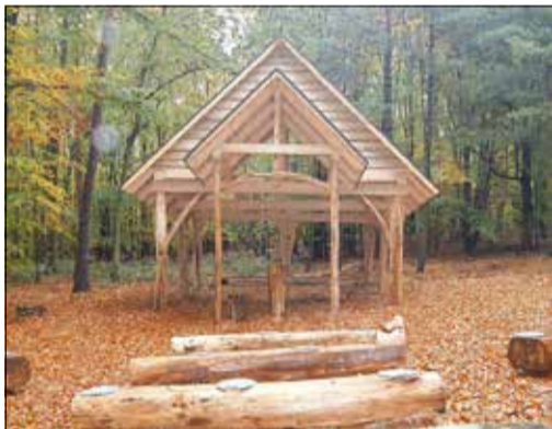
Das neue Andachtsgebäude im Wald nahe Brauna