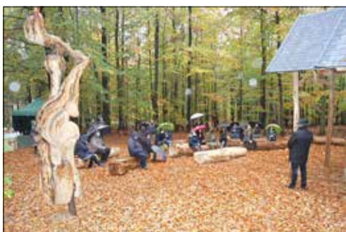
Zahlreiche Gäste waren trotz widriger Witterungsbedingungen zur Eröffnung erschienen.