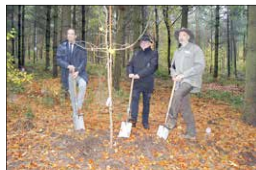
Zur Eröffnung wurde ein Ginkgo-Baum in diesem Bestattungswald gepflanzt