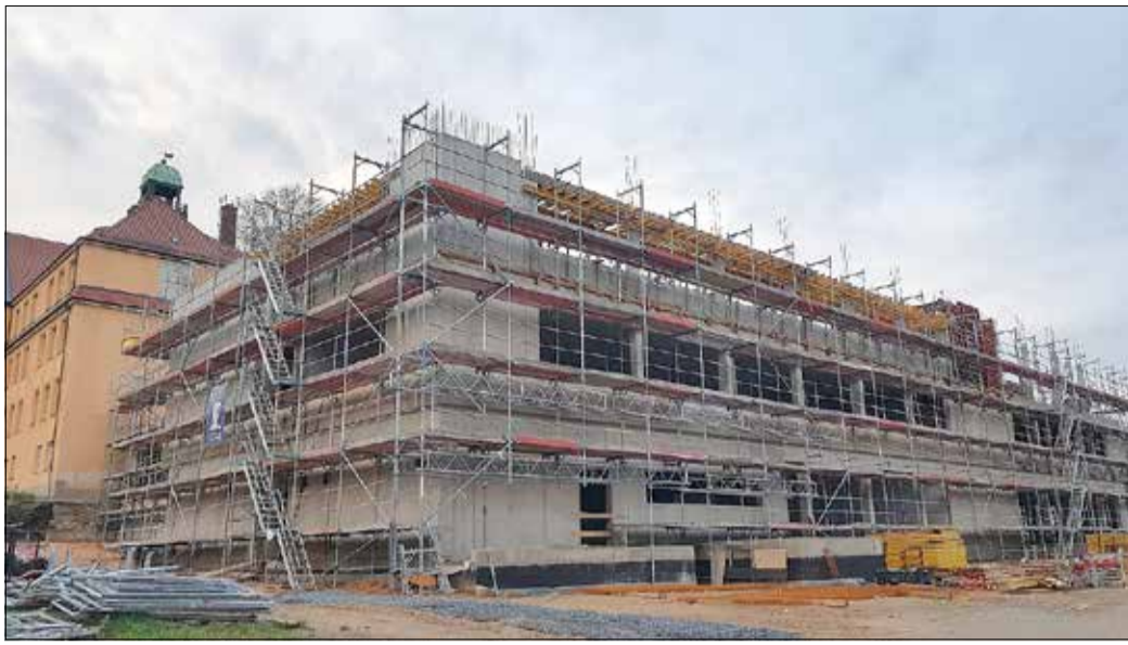
Erweiterungsneubau an der Lessingschule Stand: 1. November 2020