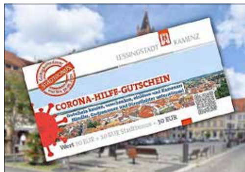
Einfach mal draufgehen: https://www.kamenz.de/corona-hilfe-gutschein.html

Am Freitag, dem 18. Juni werden Rhododendron durch die Cityinitiative e.V. am Hutberg gepflanzt und alte und neue Außengastronomie-Standorte offiziell eröffnet. Am Sonnabend, dem 19. Juni ist vielleicht ein langer Einkaufs-sonnabend mit Frischemarkt möglich. Außerdem wird die neue Website der Cityinitiative auf dem Marktplatz auf einer Leinwand präsentiert. Sonntag, der 20. Juni steht ganz im Zeichen des „Tages der offenen Gartenpforte“, der ja im letzten Jahr außerordentlich erfolgreich lief und in diesem Jahr von den Schülerinnen und Schülern der Regionalstelle Kamenz der Kreismusikschule Bautzen musikalisch begleitet wird. Und Montag, der 21. Juni - da genügen vier Worte „Fete de la Musique“ oder etwas spröder: Außengastronomie mit Life-Musik. Übrigens, der Kamenzer Corona-Hilfe-Gutschein lässt sich in diesem Reigen besonders gut einsetzen und so heißt es: Kaufen, kaufen, kaufen!!! - um die heimischen Händler und Gewerbetreibende zu unterstützen.