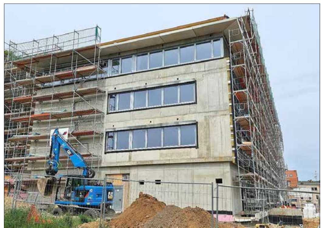
Erweiterungsneubau an der Lessingschule (Stand: 01.06.2021)