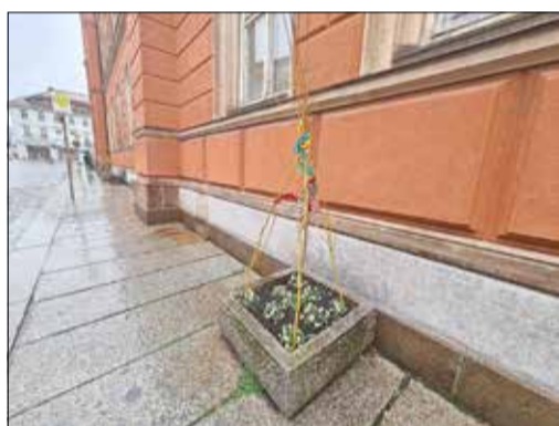
Ostergrüße am Rathaus

Wer aufmerksam durch die Kernstadt und die Ortsteile geht oder fährt, der sieht, wie fleißige Hände Schritt für Schritt das Eine oder Andere verschönern. So gibt es in unserer Stadt eine Vielzahl von Initiativen, die Projekte und Ideen für unser Kamenz voranbringen. Obwohl Ostern schon sehr lange zurückliegt, möchte ich mich nochmals - stellvertretend für viele andere Menschen - z. B. bei „den fleißigen Händen“ des Kinderhauses Wiesa „Am Heidelberg“ bedanken. Rings um den Markt „winkte“ uns ein freudiger Ostergruß entgegen.