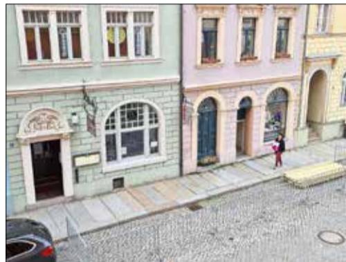
Hier tut sich was - ein Versuch ist es mindestens wert

Der ein oder andere wird es schon bemerkt haben, dass sich im Bereich der Gaststätte „Edelweiß“ und im Bereich des Ristorante Italiano „La Piazza“ außen etwas tut. Wir unterstützen gemeinsam aus der Mitte des Stadtrates heraus unsere Gaststätteninhaber, um - wenn man es innen noch nicht so gut kann - wenigstens bei dem schönen Wetter außerhalb der Gaststube Flagge zu zeigen.