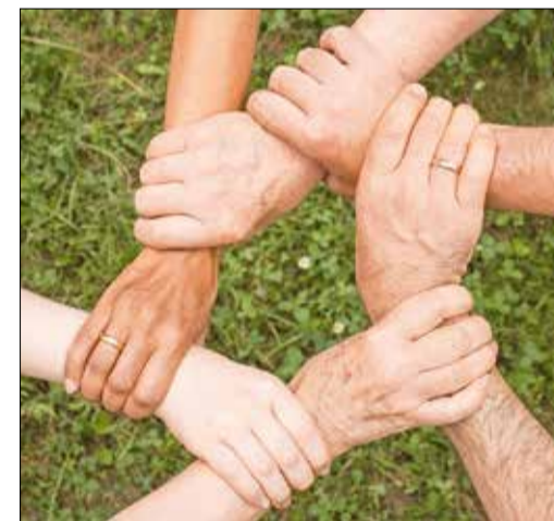
Damit wir in unserer Stadt schön leben können

Wir haben uns in den Beratungen des Stadtrates am 4. November 2020 und am 3. Februar 2021 für die Einführung eines jährlichen Bürgerbudgets in Höhe von 9.000 EUR ausgesprochen. Vorausgegangen war eine Anregung - bzw. ein Antrag der Fraktion „Die Linke“, einen Bürgerhaushalt in Höhe von 50.000 EUR einzuführen. Soweit konnten wir aber im Stadtrat gemeinsam nicht gehen. Nach einer sehr konstruktiven Diskussion haben wir uns für das Bürgerbudget und dann für eine entsprechende Verteilung im Stadtgebiet ausgesprochen.