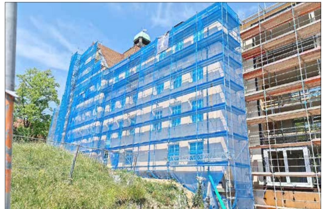
Blau gewandet präsentiert sich das historische Gebäude der Lessingschule. Vorbereitungsarbeiten für Fassadenarbeiten, einschließlich malerische Instandsetzung (Stand: 19.06.2021)