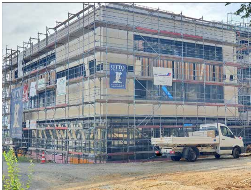
Erweiterungsneubau an der Lessingschule, Stand: 17.08.2021