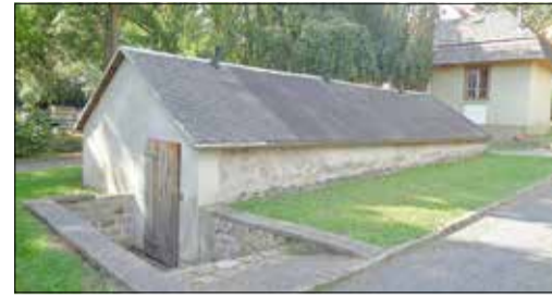
Lagergebäude vor dem Abriss im August 2021

Wir bitten alle Gewerbetreibenden, Anwohner und Nutzer der Anlage um Verständnis für die im Zuge der Bauarbeiten entstehenden Behinderungen und Einschränkungen.