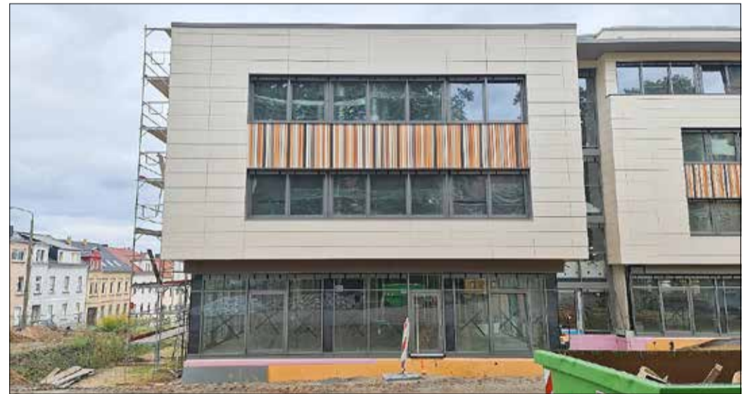
Langsam wird die Fassade am Erweiterungsneubau sichtbar – 19.09.2021