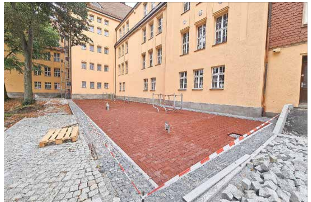
Der Innenhof zwischen historischem Gebäude und Erweiterungsneubau nimmt an dieser Stelle Gestalt an – Spielmöglichkeit für die Pause (19.09.2021).