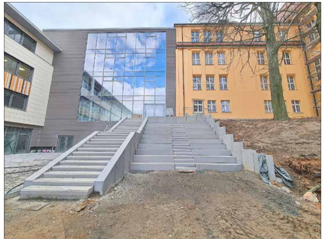
Neu und Alt: Blick des Innenhofes des Schulcampus an der Oststraße mit neu errichteter Treppenanlage – 15.02.2022