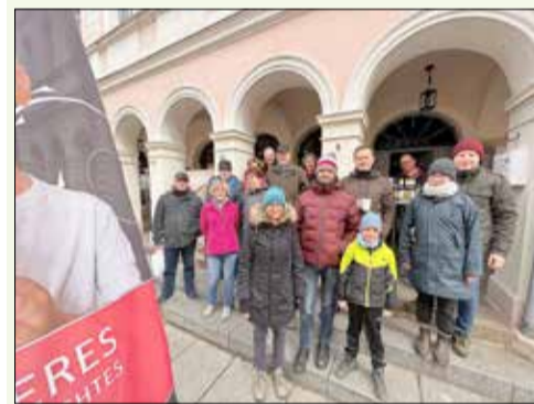
Kleiner geselliger Abschluss an den Fleischbänken dank Café Emilia und dem Kamener Fleischerverein e.V.

Fakt ist aber auch, dass die Stadtverwaltung Kamenz Hinweise der Sammler aufnimmt, die mehr dazu beitragen können, dass Müll auch entsprechend entsorgt werden kann. Dazu gehört insbesondere das Aufstellen von Hundekotbehältern zum Beispiel im Kamener Forst. Mehrere Sammler schilderten, dass Hundebesitzer den Kot ihrer Tiere zwar in einer Plastiktüte aufnehmen, werfen ihn aber in Ermangelung einer Entsorgungsmöglichkeit ins Gebüsch. Ebenfalls wurde beobachtet, dass auch in und an privaten Flächen Eigentümer wenig Sorge für Ordnung und Sauberkeit tragen. Besonders auffällig war die Ansammlung von Zigarettenstummeln in der Innenstadt vor einigen Geschäften und an einigen Containersammelplätzen. Klassen aus vier Schulen – Johann-Gottfried-Bönisch-Förderschule, Grundschule „Am Gickelsberg“, Grundschule am Forst und Lessing-Gymnasium –, der Verein „Stadtwerkstatt Kamenz-Bürgerwiese“ e. V. und das Bildungszentrum Bautzen/Kamenz/Neustadt, Standort Kamenz des Internationalen Bundes (IB), IB Mitte gGmbH für Bildung und soziale Dienste können sich nun für ihr Engagement über einen von der Stadtverwaltung gesponserte Geldprämie in Höhe von je 50 Euro freuen