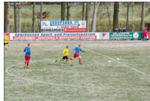
Fußballer – hier die Männer von SV 1922 Radibor e. V. und dem SV Traktor Malschwitz – lassen sich auch nicht von widrigen Wetterverhältnissen abschrecken.

So war es möglich, dass ich am vergangenen Sonntag im Namen unseres Kamener Stadtrates dem SV 1922 Radibor e. V. einen symbolischen Scheck in Höhe von 3.000,00 € überreichen konnte. Anlass war ein Fußballspiel zwischen SV 1922 Radibor e. V. (Männer) und dem SV Traktor Malschwitz. Beide Mannschaften spielen in der Richter-Bauelemente-Kreisliga Staffel 2 der Herren. Dabei handelte es sich um ein reizvolles Duell zwischen Erst- und Drittplatzierten. SV 1922 Radibor e. V. konnte mit einem überzeugenden Sieg in Höhe von 3 : 0 souverän seinen 1. Platz in dieser Spielklasse verteidigen. Dazu herzlichen Glückwunsch!