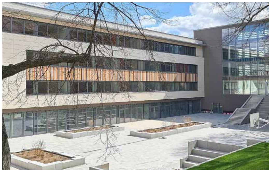
Ohne Kommentar: Stand: 11.04.2022