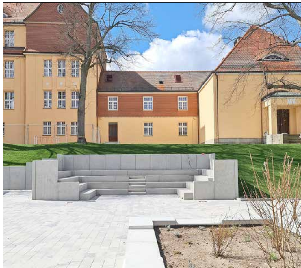
Das erste zarte Grün zeigt sich im Innenhof des zukünftigen Gymnasialstandortes an der Henselstraße und die Klön-Ecke für die Schülerinnen und Schüler ist auch schon fertig – 11.04.2022.