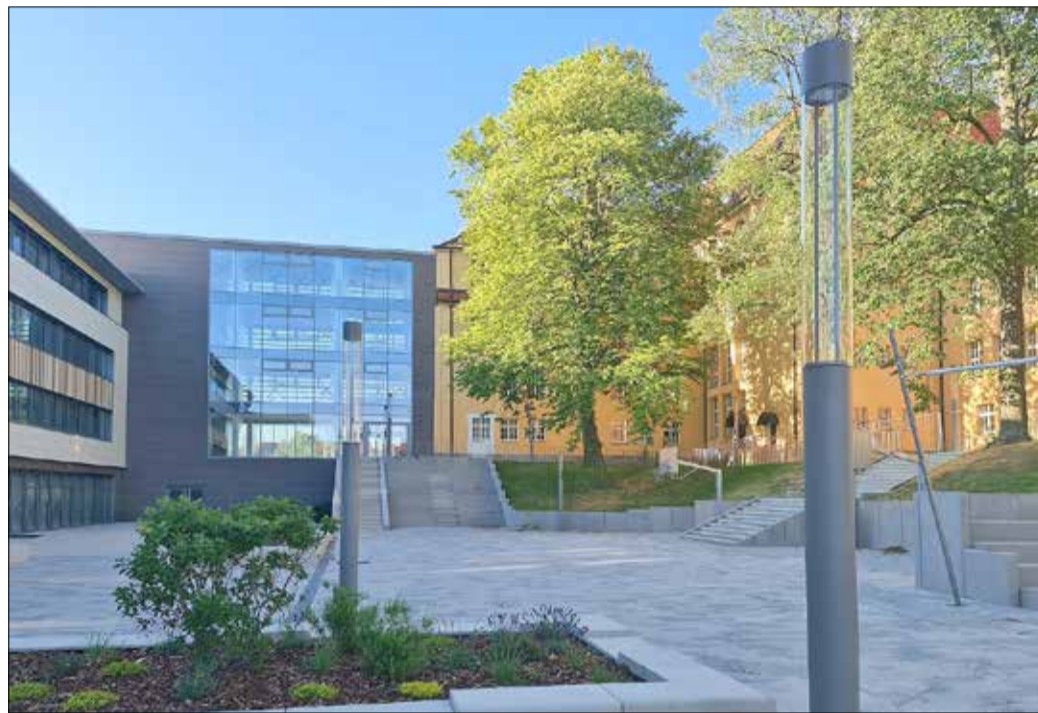
Es werde Licht an der Lessingschule – die neuen Lampen für die Innenhofbeleuchtung wurden installiert. (21.06.2022)