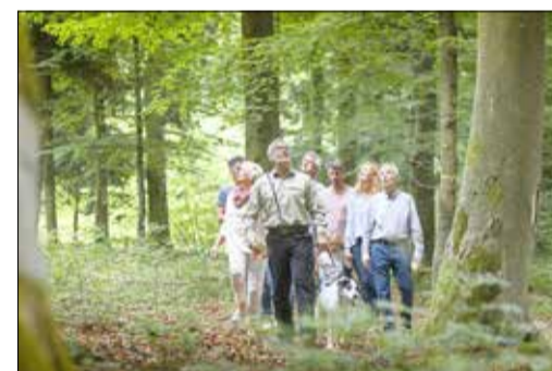
Waldführung durch den FriedWald

Bei einer kostenlosen Waldführung durch den FriedWald Kamenz haben Interessierte am 25. Juni 2022 um 16 Uhr wieder die Möglichkeit, mehr über die Bestattung in der Natur zu erfahren.