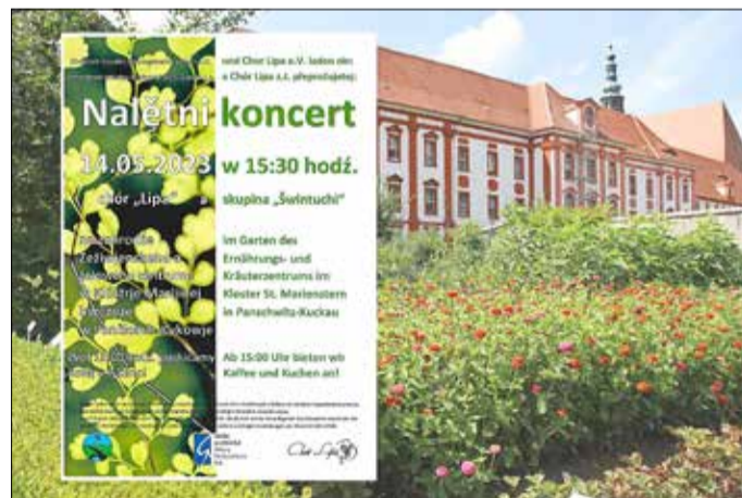
Frühlingskonzert im Kloster St. Marienstern