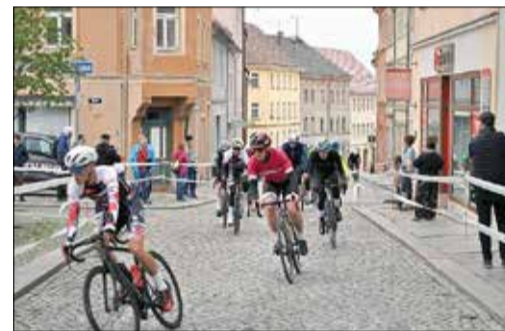
Runden-Durchfahrt am Marktplatz