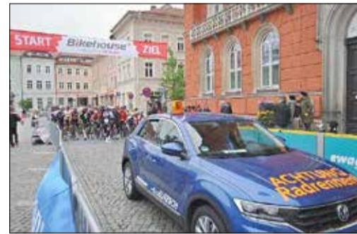
Start des 80 km Radrennens

(Alle Ergebnisse detailliert unter https://baer-service.de/ergebnisse/BLU/2023 )