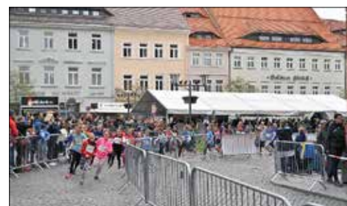
Start eines Kinderlaufes

(alle Ergebnisse detailliert unter https://baer-service.de/ergebnisse/BLU/2023 )