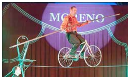
Wenn auf einmal das Leben auch zum Drahtseilakt wird

Mit einem Brief wandte sich vor kurzem der Circus „Moreno“ an die Stadt Kamenz: „Hallo Herr Bürgermeister. Ich bitte um Hilfe in unserer Not-situation. Dem Circus „Moreno“ wurden die ganzen Ersparnisse gestohlen, das Weiterreisen nach Weißwasser war nur möglich durch die Vorstel-