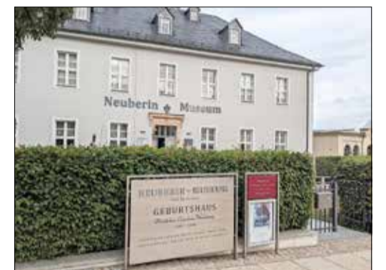
Das Neuberin-Museum in Reichenbach