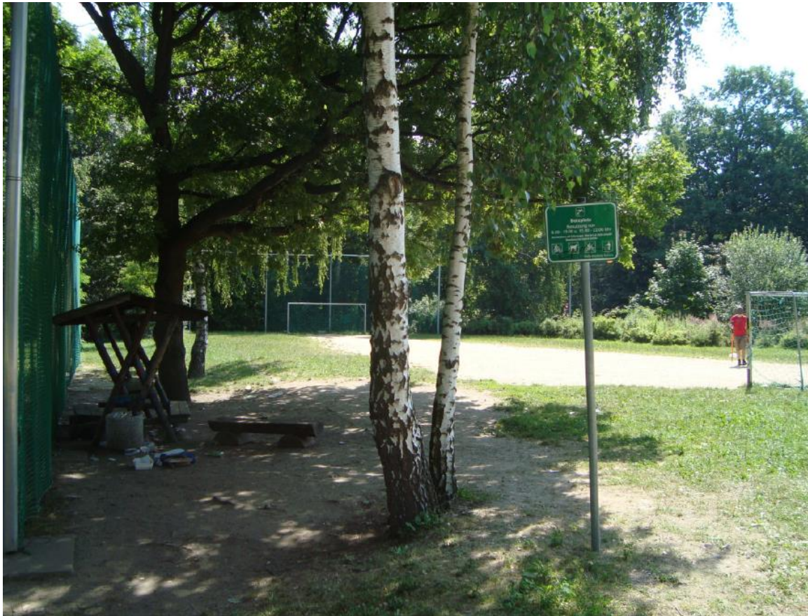
Bestand vor der Neugestaltung (2018),