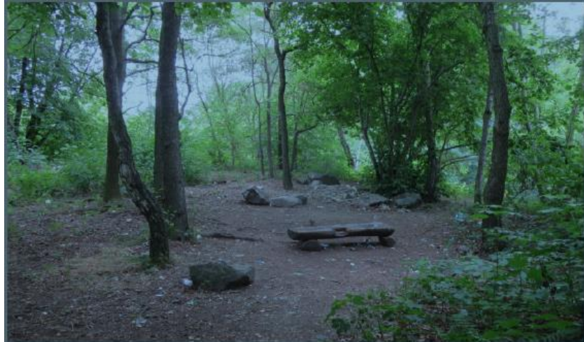
Bestand Lichtung im Wäldchen, 2018