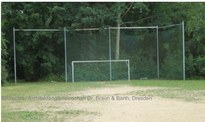
Bestand Bolzplatz, 2018